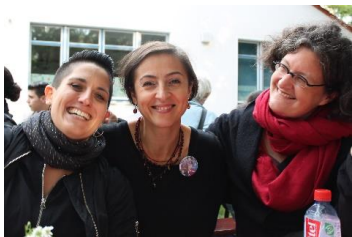
Gemeinsamer Einsatz für Begegnungsorte: der Stadtteilzentrenverbund Neukölln

Dabei hat der Verein Selbsthilfe- und Stadtteilzentrum Neukölln Süd e.V. mit seinen Projekten des Selbsthilfe- und Stadtteilzentrums Neukölln-Süd die Ausrichtung auf den Süden Neuköllns (Britz, Gropiusstadt, Buckow, Rudow), und Nachbarschaftsheim Neukölln e.V. setzt den Fokus auf Nord-Neukölln.